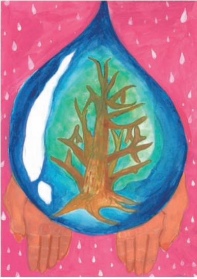
イラスト・升田 菜蒨 福岡県与原小学校6年 第15回生