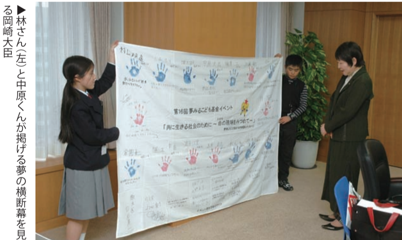
▶林さん(左)と中原くんが掲げる夢の横断幕を見る岡崎大臣