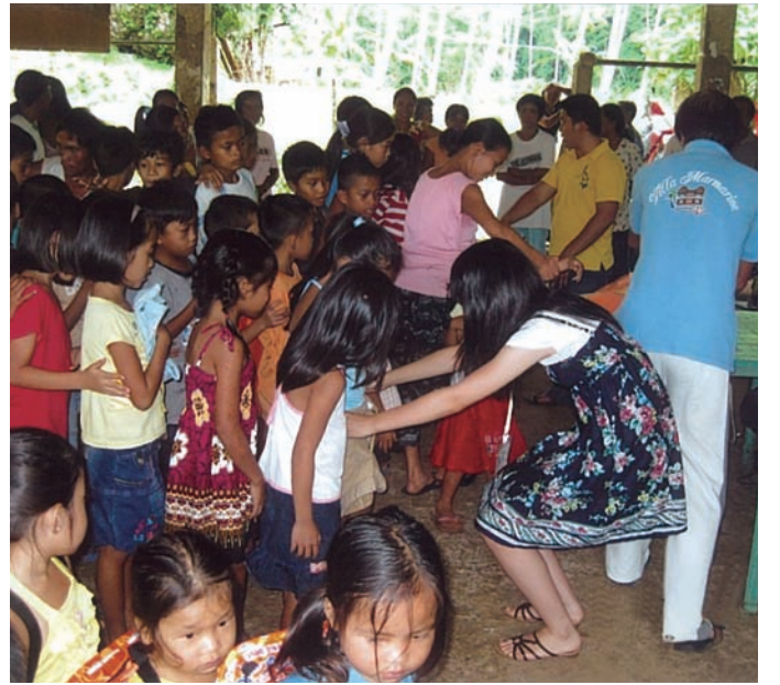
フィリピンエンジェルキッズでの活動風景