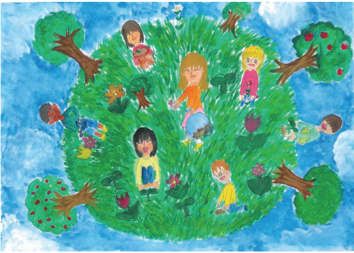
イラスト・矢川 永莉香