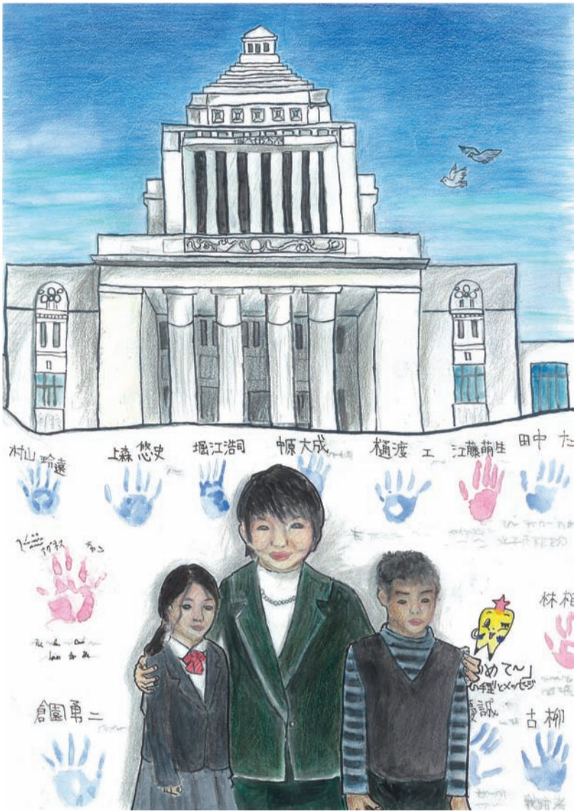
イラスト・林 桜子 国会議事堂をバックにこどもたちの「夢」に耳を傾ける岡崎大臣

※「ECOko」とは環境問題を考えるこどもたち、Ecology+Kodomoの造語です。